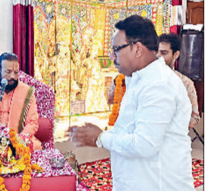
फोटो: 30सिरसा02 : कथा में पूजा-अर्चना करते श्रद्धालु।