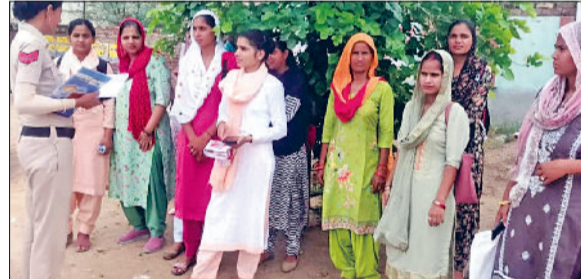
फतेहाबाद। महिला सुरक्षा को लेकर युवतियों को जागरूक करती पुलिस कर्मचारी।