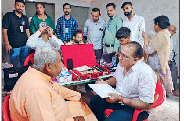
फतेहाबाद। कैम्प में लोगों के स्वास्थ्य की जांच करते चिकित्सक।