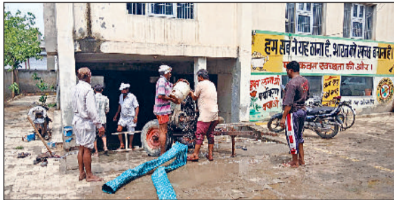
रतिया। नगर पालिका कार्यालय से पानी निकालते हुए नगर पालिका कर्मचारी।

शहर में रविवार शाम को आई मूसलाधार बारिश से जहां शहर में पानी की निकासी का उचित प्रबंध ना होने पर जगह जगह पानी भरने से आमजन को परेशानियों का सामना करना पड़ा वहीं जलभराव से नगरपालिका के बेसमेंट में ही पानी भर जाने की नगरपालिका प्रशासन की कार्य प्रणाली पर ही सवालिया निशान उठ रहे हैं।