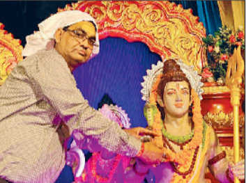
रतिया। पूजन करते हुए मंडल सदस्य।