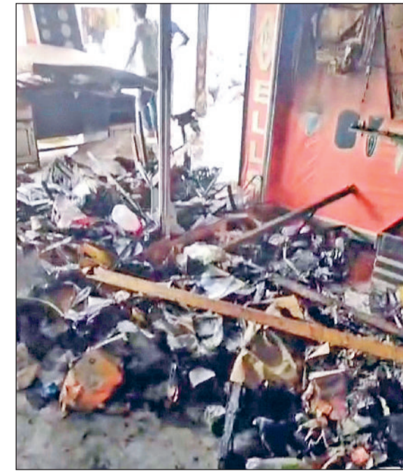
फतेहाबाद। दुकान में आग से जला सामान।

शहर के पुराने बस स्टैंड के पास ताऊ देवीलाल मार्केट में स्थित इलेक्ट्रॉनिक्स आइटमों के एक शोरूम में सोमवार अलसुबह अचानक भीषण आग लग गई। पड़ोसियों ने दुकान से धुआ निकलते देखकर इस बारे दुकान मालिक को सूचना दी। सूचना मिलते ही दुकान मालिक मौके पर पहुंचा और फायर ब्रिगेड को बुलाया। मौके पर पहुंची फायर ब्रिगेड की चार गाड़ियों ने करीब दो घंटे की मशक्कत के बाद आग पर काबू पाया लेकिन तब तक शोरूम में रखा लाखों रुपये का इलेक्ट्रॉनिक्स का सामान जलकर स्वाह हो चुका था। दुकान में आग लगाने का कारण शार्ट मार्किट माना जा रहा है। मिली जानकारी के अनुसार ताऊ देवीलाल