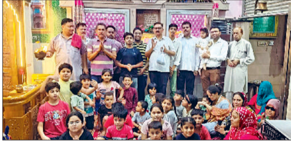
फतेहाबाद। प्राचीन बाबा रामदेव मंदिर में पूजा अर्चना करते श्रद्धालु।